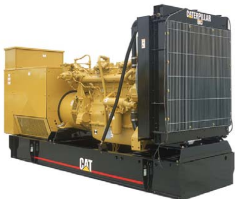
Генераторная установка показана с оборудованием, устанавливаемым по специальному заказу